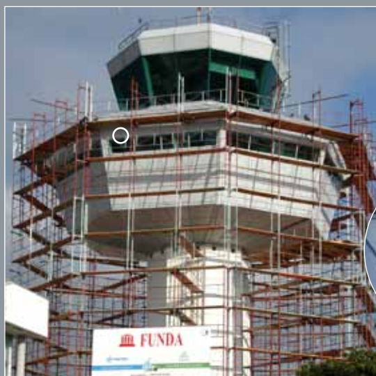
Kontrolni toranj, Zračna luka Dubrovnik 500 m 2 Protan SE 1,5 mm Boja: Svijetlo siva