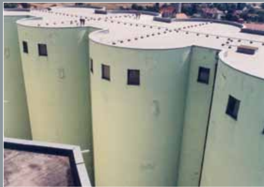
Koka Silosi, Varaždin

1.500 m 2 Protan SE 1,2 mm Boja: Svijetlo siva