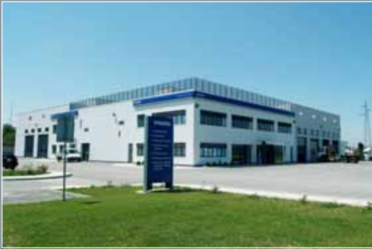
Volvo centar, Zagreb

2.400 m 2 Protan SE 1,6 mm Boja: Svijetlo siva