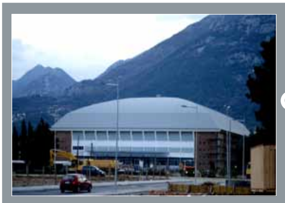
Sportska dvorana, Bar, Crna Gora

5.500 m 2 Protan SE 1,6 mm Boja: Svijetlo siva