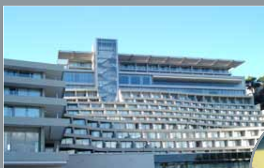
Hotel Rixos, Dubrovnik 15.000 m 2 Protan GG 2.0mm, G 1,5 mm i SE 1.6mm Boja: Svijetlo siva, žuta