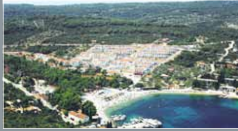
Otok Šolta, Naselje Nečujam

40.000 m 2 Protan SE 1.2mm, 1.6mm i GG 2.0mm Različite boje