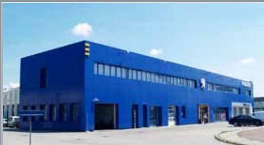
Peugeot Jankomir, Zagreb

750 m 2 Protan SE 1,6 mm Boja: Svijetlo siva