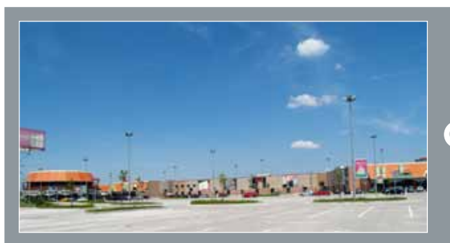
Outlet centar, Sveta Helena

20.000m 2 Protan SE 1,6 mm Boja: Svijetlo siva