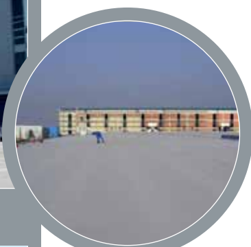
Trgovački centar KONZUM, Remetinec

Odrađeni centri: Ivanić Grad, Remetinec, Dubrava, Ivanec, Sisak, Split Slrobuja i Lepoglava