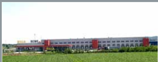
Billa, Sveta Helena

24.000 m 2 Protan SE 1,6 mm Boja: Svijetlo siva