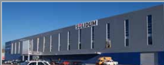
Solidum centar, Zagreb