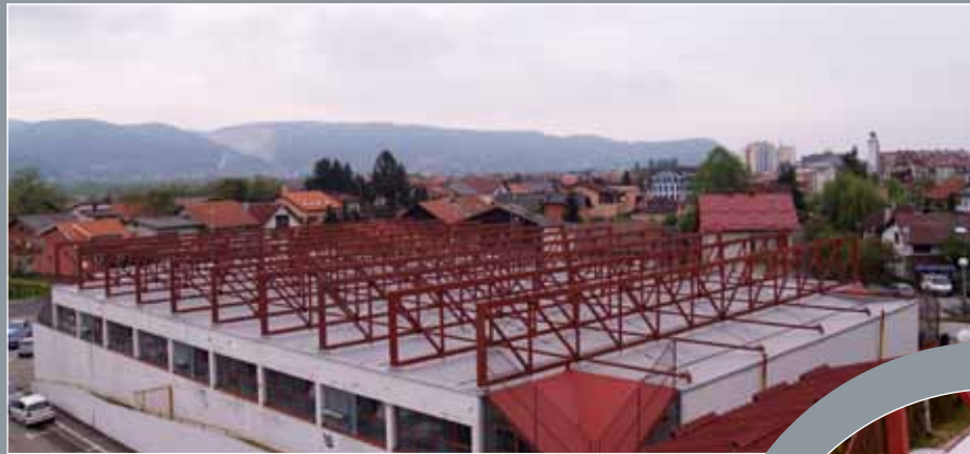
Sportska dvorana, Zaprešić

1.600 m 2 Protan SE 1,6 mm Boja: Svijetlo siva i crvena