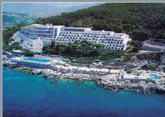
Apartmansko naselje Dubrovački vrtovi sunca 10.000 m 2 Protan G 1,5 mm, Protan GG 2.0mm i Protan SE 1.6mm