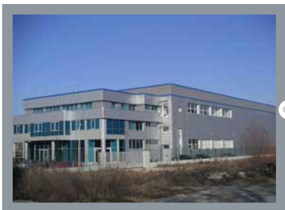
Anić, Split 800 m 2 Protan SE 1,2 mm Boja: Svijetlo Siva

1.200 m 2 Protan SE 1,6 mm Boja: Svijetlo siva