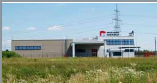
C Pakiranje, Sveta Helena

2.000 m 2 Protan SE 1,6 mm Boja: Svijetlo siva