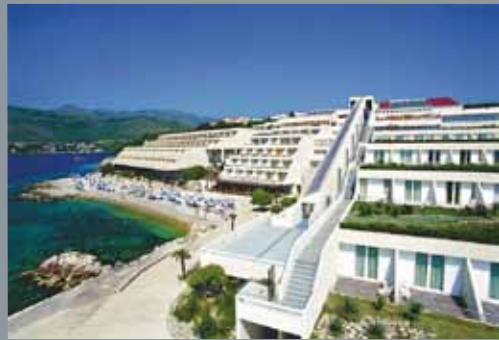
HOTEL PRESIDENT, DUBROVNIK